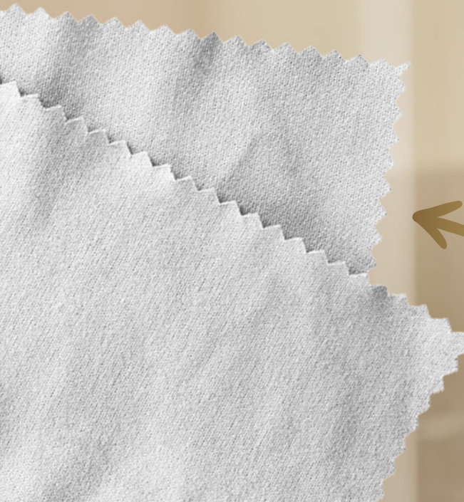
ściereczka z mikrofibry